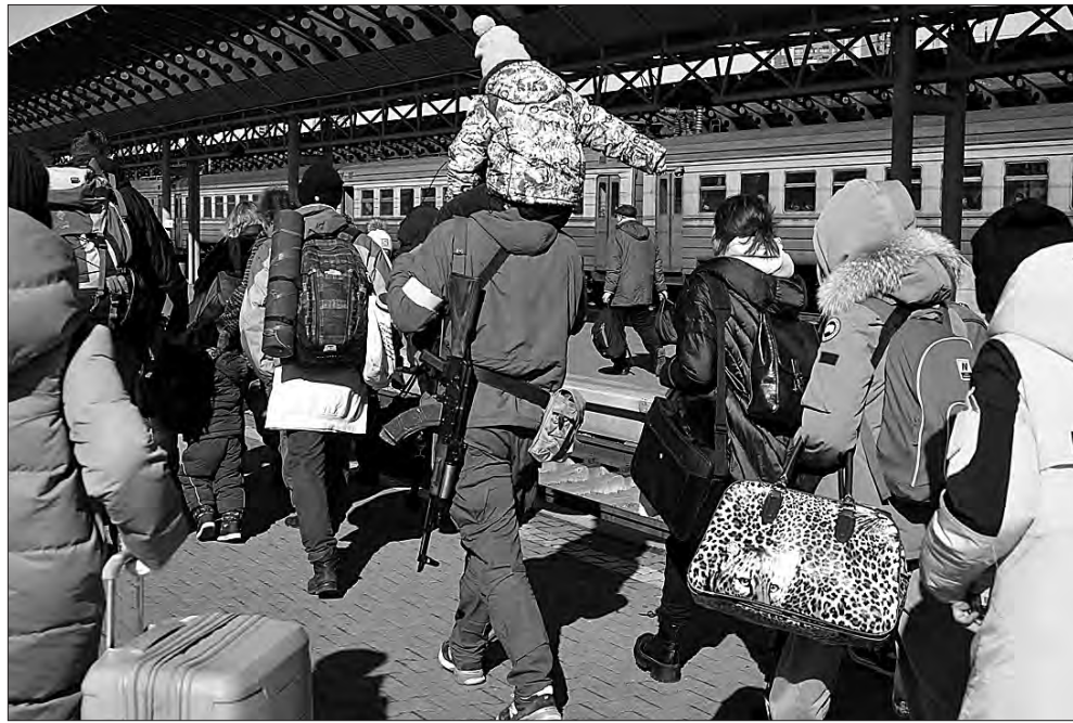
28 лютого 2022 року. Київ, вокзал. Сім'я — в евакуацію, чоловік — у тероборону.

Буча, Ірпінь, Гостомель, оборона Києва, Маріуполь-«Азовсталь», Херсон, Харків, бій за Донбас, Бахмут, підрив Каховської ГЕС, загроза підриву ЗАЕС — найпотужнішої атомної станції в Європі. Російська тактика випаленої землі, міста в облозі, нехтування усіма правилами ведення війни, звірства окупантів, ІПСО, ракетні атаки по цивільній інфраструктурі... Все це Україна пройшла, витримала, вистояла протя-