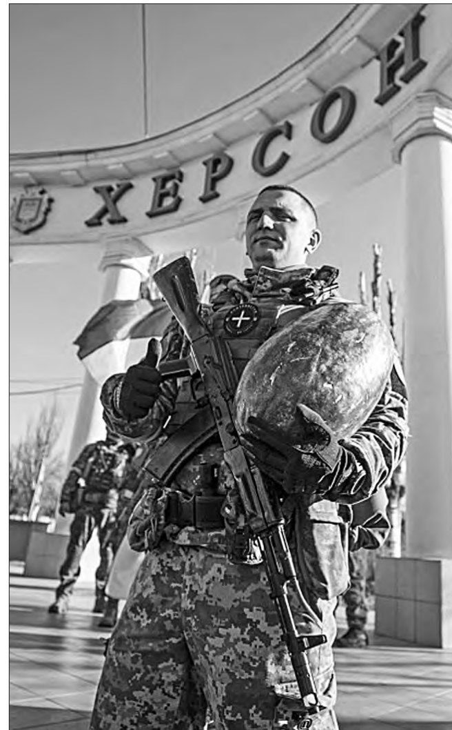
11 листопада 2022 року. Херсон визволено. Збройні Сили України зайшли в місто.

Ми змушені жити, боротися, працювати, ростити дітей в умовах війни. Це реальність, яку нам нав'язала росія. Попри все українці багато чого навчилися за цей