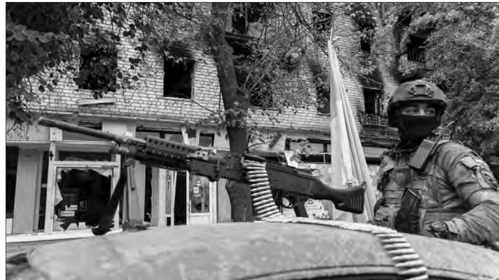
14 вересня 2022 року. Ізюм, український військовий.