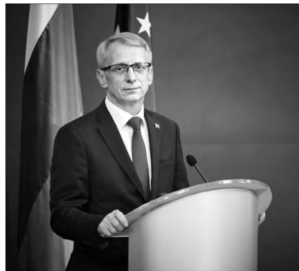
Прем'єр-міністр Болгарії Ніколай Денков.

загалом — в оборонному секторі», — заявив Володимир Зеленський після переговорів з Ніколаєм Денковим.