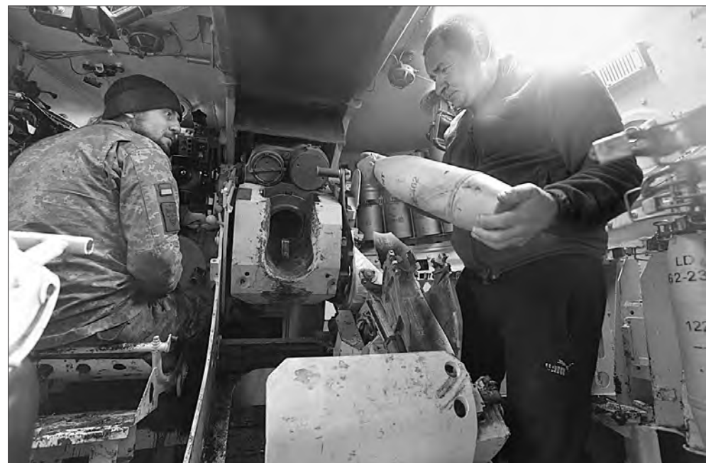
Квітень 2023 року. Бахмутський напрямок. На позиціях 57-ї окремої мотопіхотної бригади імені кошового отамана Костя Гордієнка. Бійці САУ заряджають гармату.