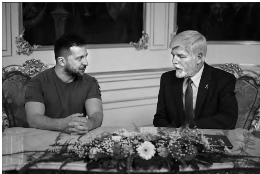
Володимир Зеленський та Петр Павел.

країні. «Я надзвичайно вдячний за те, що болгарський народ прихистив велику кількість українців. Я думаю, що люди в Болгарії чітко розуміють, що це не «конфлікт», а війна. Тому що коли конфлікт, то мільйони людей не виїжджають із країни, щоб зберегти життя своїх дітей. Війна на нашій території, на нашій землі, тому ми чітко знаємо, що